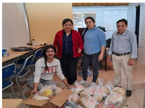
Participación en elaboración de kits para damnificados de la parroquia San Luis.