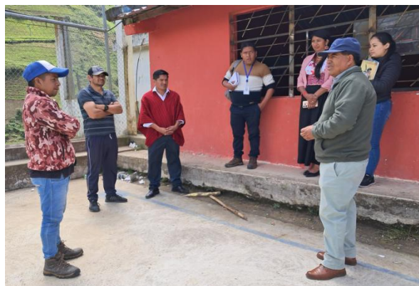
Constatación y Verificación de Molino con SDPN en la comunidad Cachisagua.