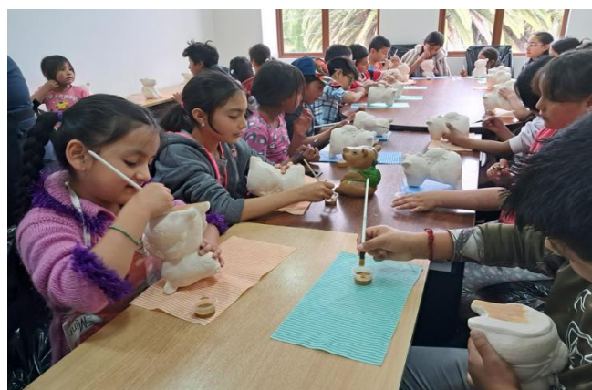
Acompañamiento en inicio de curso vacacional.