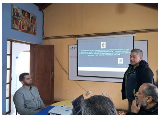
Participación en la reunión de trabajo Fundación Promoción Humana.