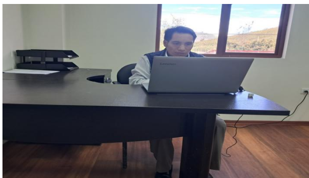
Revisión y consolidación de la factura y Ordenes de Combustible para el pago al proveedor correspondientes al mes mayo 2025.