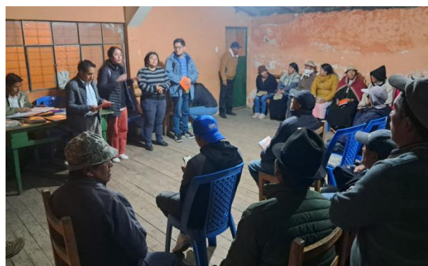
Finalización de proyecto de Vinculación con la UEB Posgrados en la comunidad Tagma San José