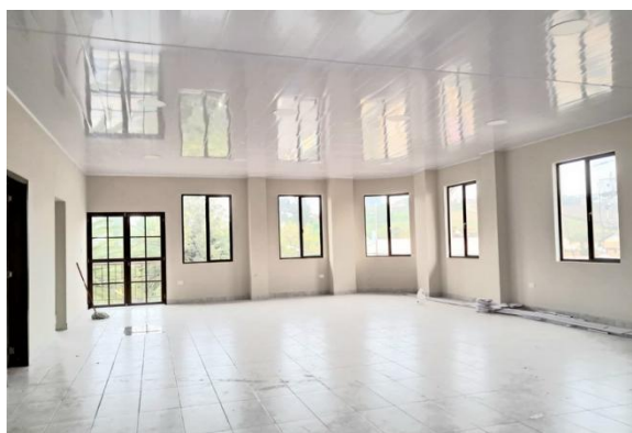
Verificación y constatación de avances de colocación de tumbado de segunda etapa de la casa parroquial

Dirección: Ángel Polibio Chávez y 5 de Junio, Parroquia San Simón – Cantón Guaranda - Provincia Bolívar.