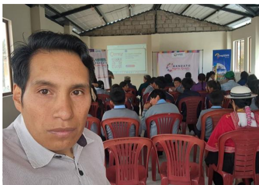
Participación en Taller de Mandato Mujeres Rurales 2025, realizado por CONAGOPARE Nacional.