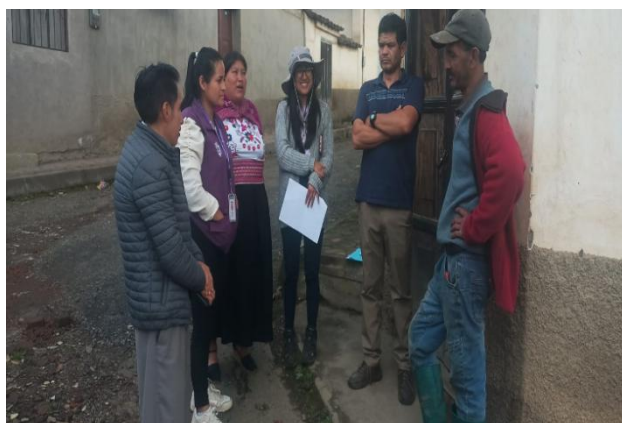
Constatación de Inicio de Obra del alcantarillado en el barrio La Merced.