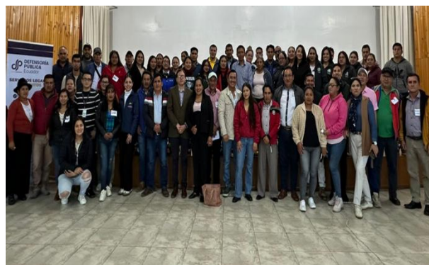
Participación en Capacitación sobre el manejo eficiente de recursos públicos y delitos contra la administración pública organizada por GONAGOPARE Bolívar.