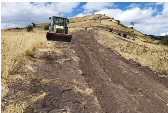
Coordinación y trabajos con la maquinaria en la comunidad de Cachisagua para excavaciones y entierro de tubos de sistema de riego.