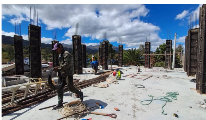
Seguimiento y constatación del avance de la obra de la casa parroquial segunda etapa.