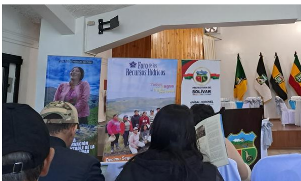
Participación en la reunión de Encuentro del Foro de Recursos Hídricos de la Provincia Bolívar”

Dirección: Ángel Polibio Chávez y 5 de Junio, Parroquia San Simón – Cantón Guaranda - Provincia Bolívar.