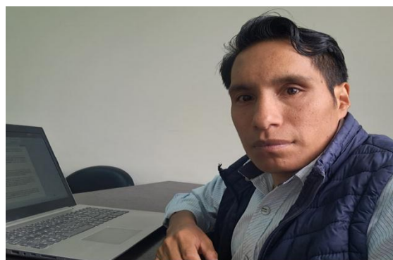
Desarrollo de actividades diarias de oficina – Actualización de Informes de necesidad y TDR para mantenimiento de la Retroexcavadora B95B.