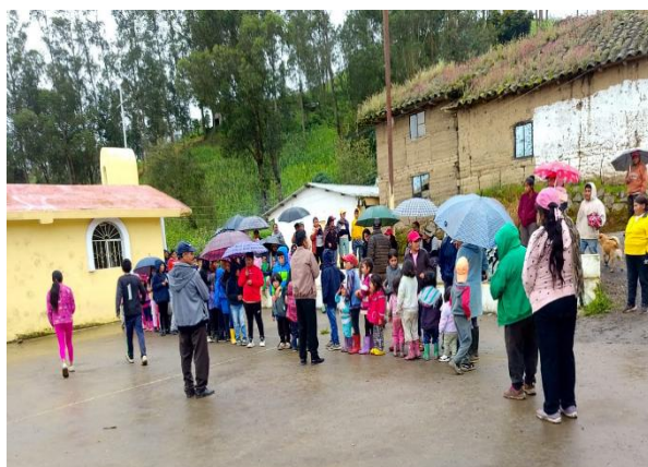
Gestión y Compartimiento de Cajitas Samaritana a los niños de la comunidad de Shacundo y su respectiva entrega.