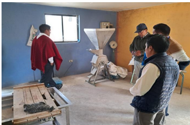
Constatación y Verificación de Molino con SDPN en la comunidad Pachagrón.