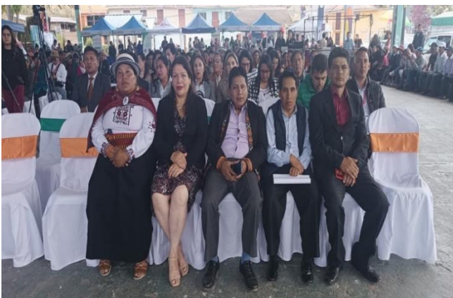
Participación en desfile y sesión solemne por 140 años de parroquialización.