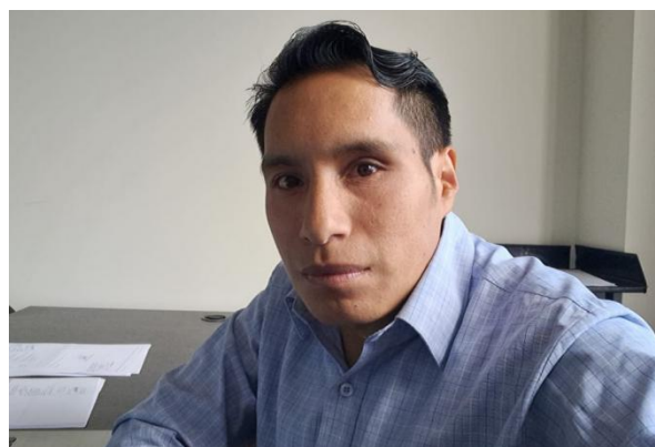
Desarrollo de actividades diarias de oficina - Inicio del procesos y Fase Preparatorias de los procesos de Ínfima Cuantías.