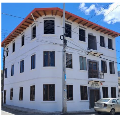
Constatación del avance de la obra de la casa parroquial segunda etapa.