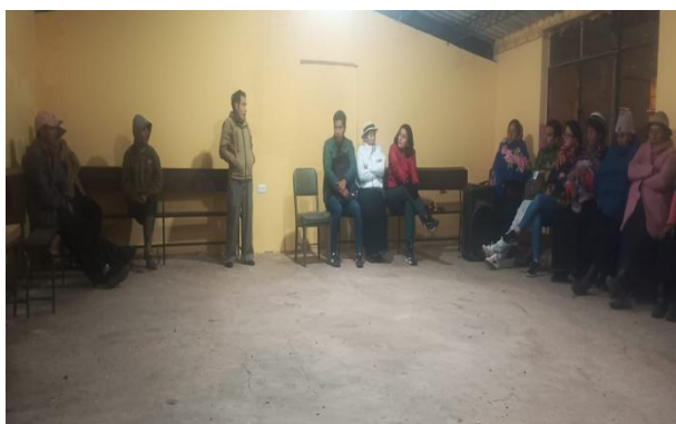
Socialización y consideración para el manejo adecuado de proyecto de Molino en la comunidad de Cachisagua.

Dirección: Ángel Polibio Chávez y 5 de Junio, Parroquia San Simón – Cantón Guaranda - Provincia Bolívar.