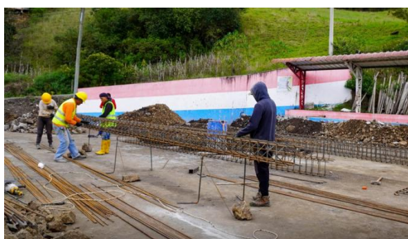
Coordinación y verificación de avances de la obra en la comunidad de Tagma San José realizado por parte del GADC Guaranda.