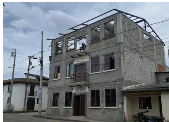
Constatación del avance de la obra de la casa parroquial segunda etapa.