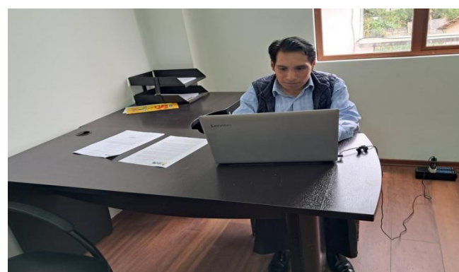
Revisión, consolidación de la factura con Ordenes de Combustible y emisión del informe para el pago al proveedor correspondientes al mes junio 2025.