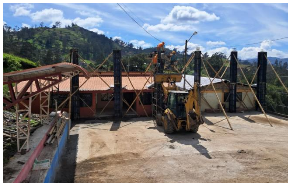
Coordinación de trabajos en la construcción de la cubierta en la comunidad Tagma San José con los técnicos del GADC Guaranda.