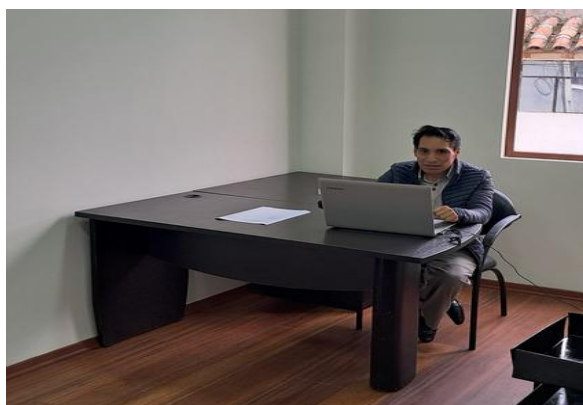
Desarrollo de actividades diarias de oficina.