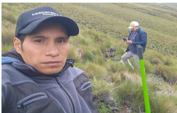
Recorrido Quillunga con los técnicos de la ESPOCH para recolección de muestreo de tipo del suelo.

Dirección: Ángel Polibio Chávez y 5 de Junio, Parroquia San Simón – Cantón Guaranda - Provincia Bolívar.