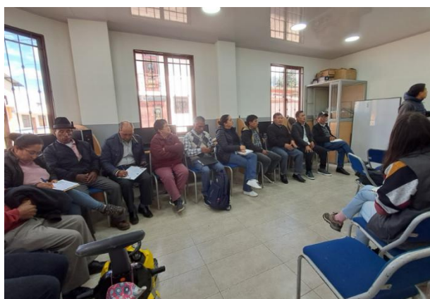
Participación en la socialización de Ordenanza que regula la declaratoria de áreas protegidas municipales; que permitan la protección de fuentes y zonas de recarga hídricas.