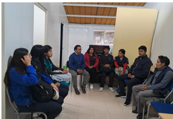
Unión y coordinación para campaña de Esterilización canina con la UEB.