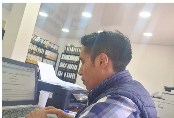
Modificación y actualización de Especificaciones Técnicas e Informe de Necesidades para el nuevo proceso de Combustibles para las maquinarias del GADIAPSS.