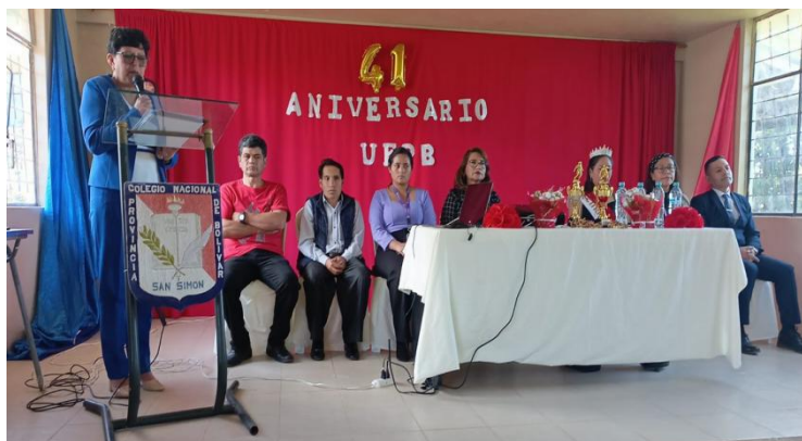
Participación en el aniversario de Unidad Educativa Provincia Bolívar.

Dirección: Ángel Polibio Chávez y 5 de Junio, Parroquia San Simón – Cantón Guaranda - Provincia Bolívar.