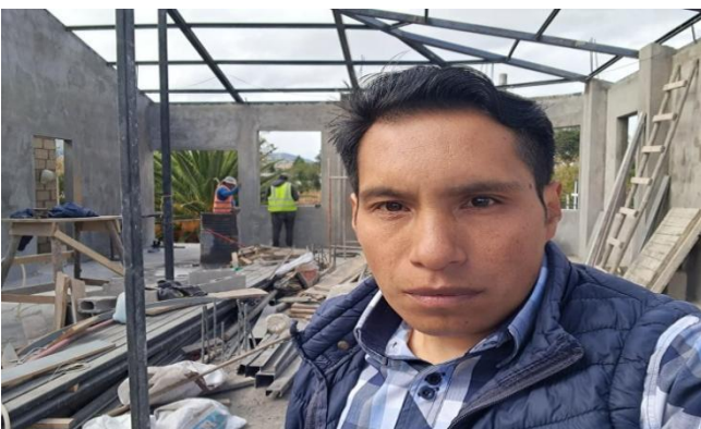
Seguimiento y constatación del avance de la obra de la casa parroquial segunda etapa.