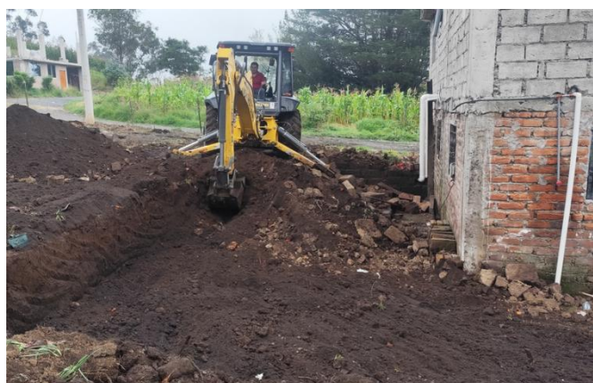
Coordinación y trabajos con la maquinaria en Gradas Central en desalojo de escombros.