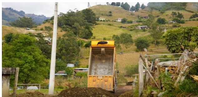
Coordinación de trabajos de vialidad con maquinaria de municipio cantón Guaranda y Cabildo Gradas en Ampliación de vía desde Gradas Central hasta Gradas Chico.