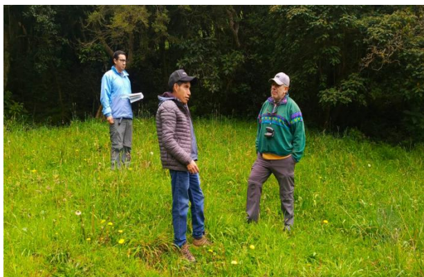
Recorrido para toma de inventario de bosque nativa Diablo Sacha - Suropotrero.