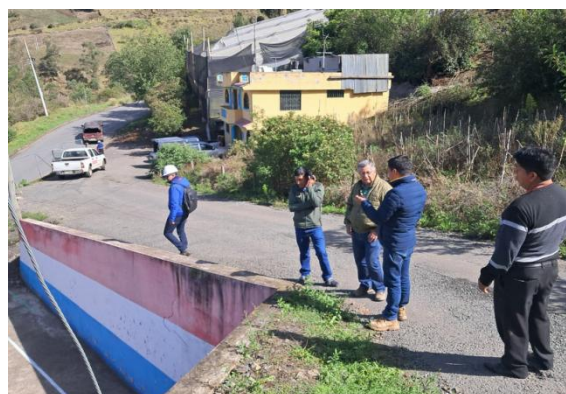
Coordinación de trabajos para la construcción de la cubierta en la comunidad Tagma San José con los técnicos del GADC Guaranda y el Contratista.