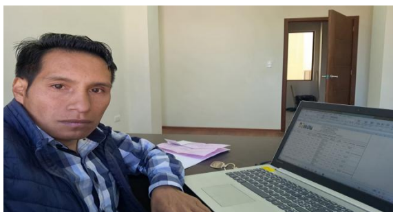
Elaboración de informe para el respectivo pago de Combustible de maquinarias del GADIAPSS correspondiente al mes de noviembre.