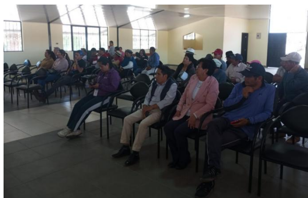
Participación en taller de Presupuesto Participativo de GAD Provincial.