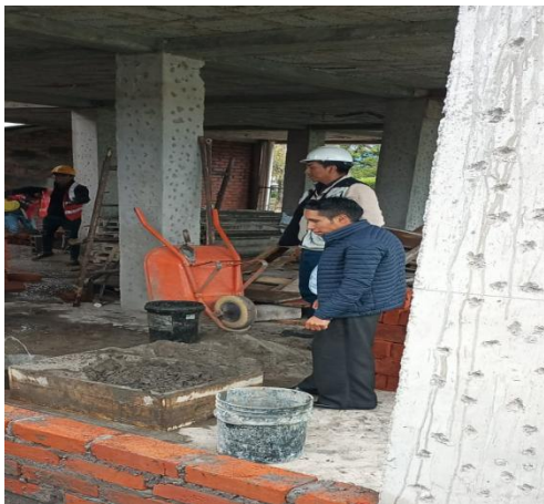
Constatación de avances de trabajos de la obra casa parroquial.