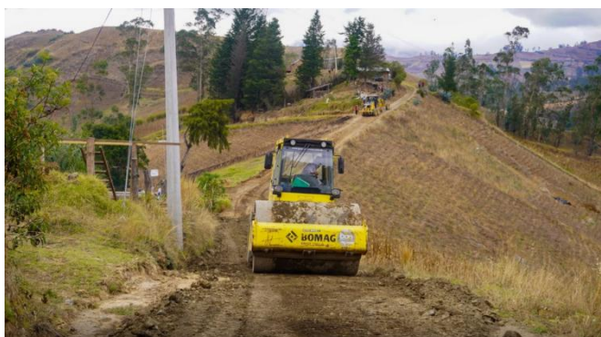
Coordinación de trabajos de vialidad con maquinaria de municipio cantón Guaranda en mantenimiento y rasanteo en Coventillo.