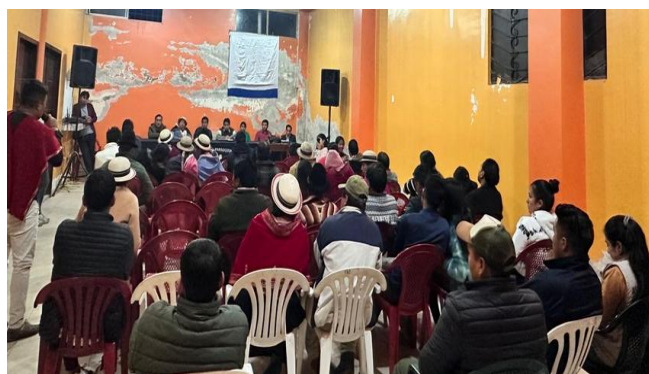
Participación en Rendición de Cuentas Institucional y Autoridades Electas del periodo 2024.