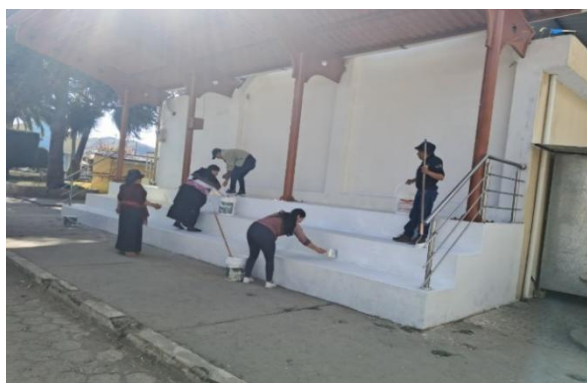
Participación en minga general de limpieza y pintado del parque para la parroquialización.