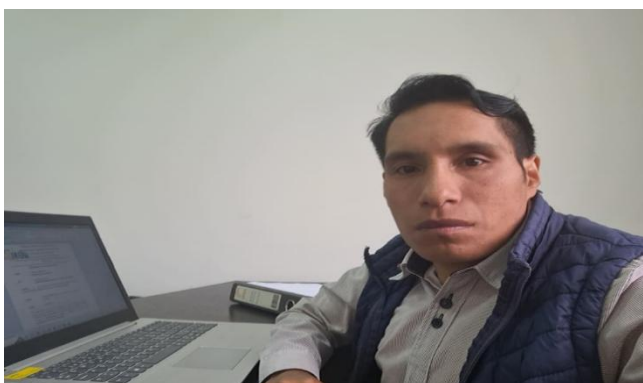
Elaboración de Informe de Necesidad y Especificaciones Técnica para proceso de mantenimiento de la Volqueta.

Dirección: Ángel Polibio Chávez y 5 de Junio, Parroquia San Simón – Cantón Guaranda - Provincia Bolívar.