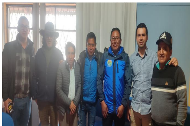
Participación en la reunión de trabajo sobre “Diagnóstico de la situación de los páramos e inventario de las fuentes de agua en el Área de Conservación y Uso Sustentable”