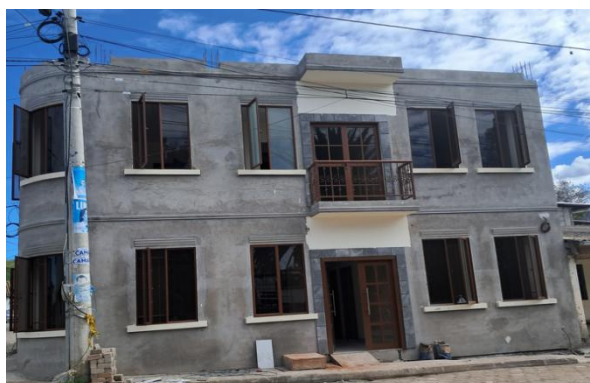
Constatación de trabajos de construcción de la obra casa parroquial.