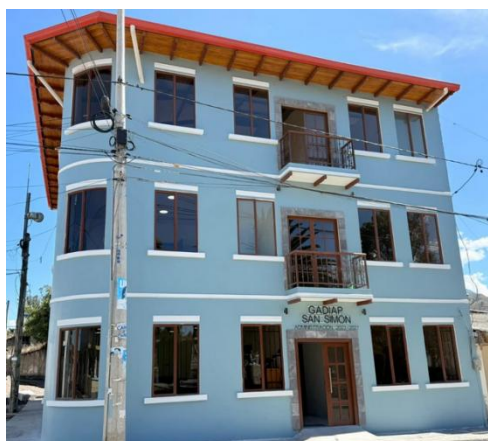
Seguimiento y constatación del avance de la obra de la casa parroquial segunda etapa.