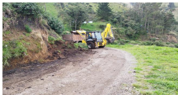
Coordinación de maquinarias en limpieza de la vía en la comunidad de Shulala.