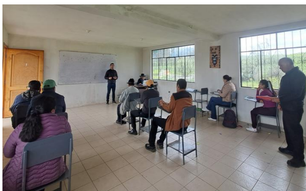
Participación de Mesa Técnica Parroquial - ACUS