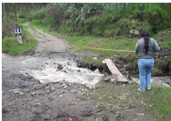
Acompañamiento al técnico de la Prefectura para realizar el Estudio previo construcción cabezales y colocación de tubos, en vía Shacundo – Capito.