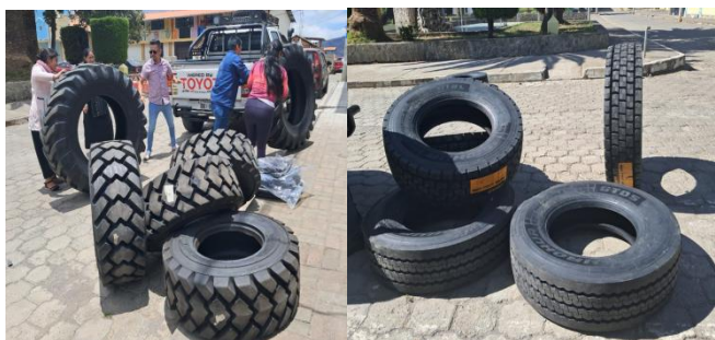
Recepción de “ADQUISICIÓN DE NEUMATICOS Y TUBOS PARA EL EQUIPO CAMINERO DEL GADIAP SAN SIMÓN”.

Dirección: Ángel Polibio Chávez y 5 de Junio, Parroquia San Simón – Cantón Guaranda - Provincia Bolívar.