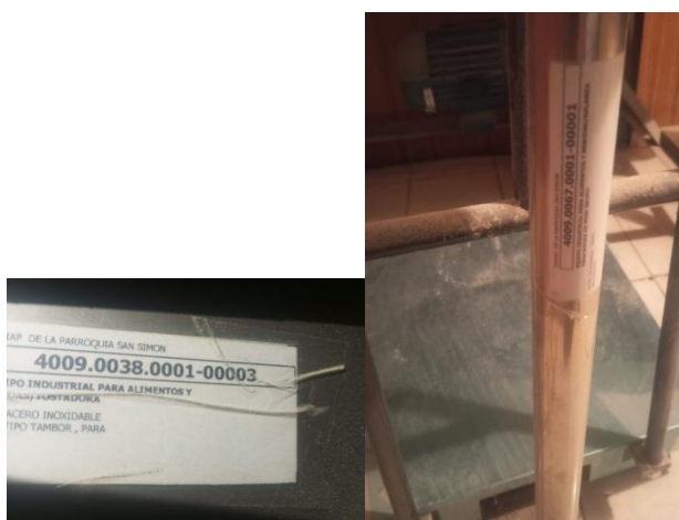
Toma Física de los bienes del GADIAPSS.

Dirección: Ángel Polibio Chávez y 5 de Junio, Parroquia San Simón – Cantón Guaranda - Provincia Bolívar.