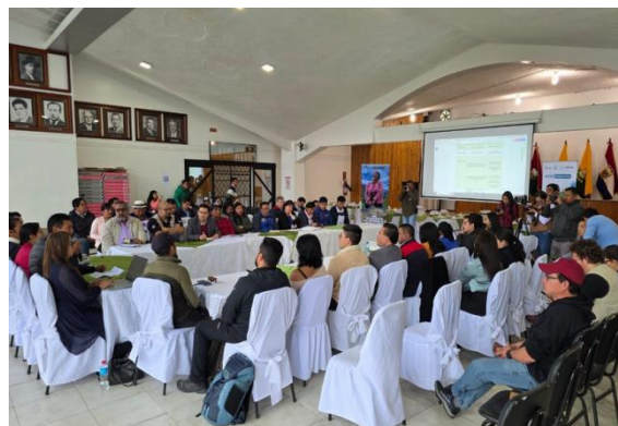
Participación en Lanzamiento del Proyecto para la creación del Área de Conservación y Uso Sustentable Estribaciones de Montaña, organizado por Prefectura – ACUS Provincial.