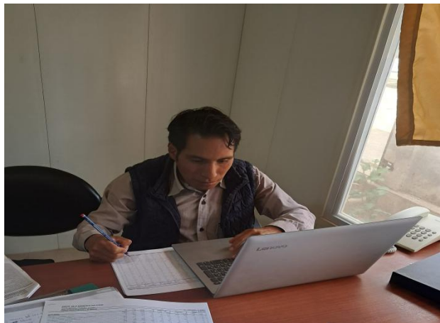
Elaboración del Informe de Constatación de Bienes del GADIAPSS.