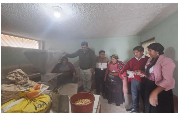
Constatación y Verificación de Molino con SDPN en la comunidad Shulala.