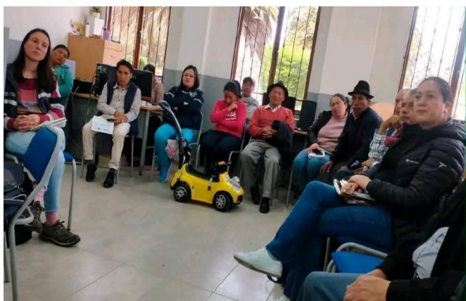
Participación de Mesa Técnica Parroquial - ACUS.