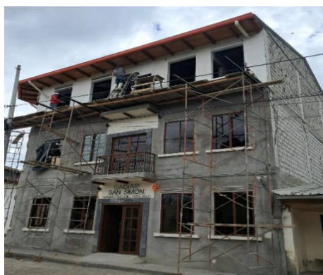
Constatación del avance de la obra de la casa parroquial segunda etapa.

Dirección: Ángel Polibio Chávez y 5 de Junio, Parroquia San Simón – Cantón Guaranda - Provincia Bolívar.