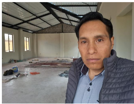
Seguimiento y constatación del avance de la obra de la casa parroquial segunda etapa.