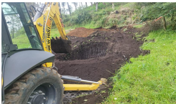
Coordinación y trabajos con la maquinaria a los emprendedores de la comunidad Tandahuan.