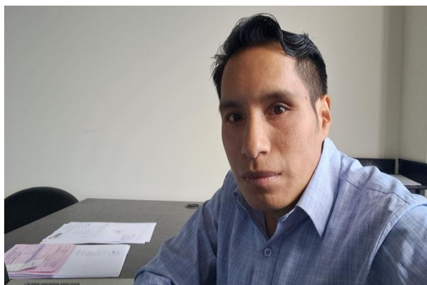
Elaboración y consolidación de Ordenes de Combustible de la Gallineta y Volqueta de la Institución del mes de mayo para el respectivo informe y pago.