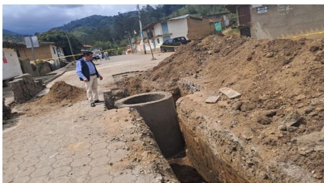
Verificación del avance de la obra de construcción del alcantarillado barrio 3 de mayo.

Dirección: Ángel Polibio Chávez y 5 de Junio, Parroquia San Simón – Cantón Guaranda - Provincia Bolívar.