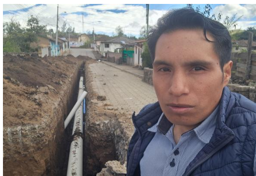
Verificación de colocación de tubos de alcantarillado en el Barrio Tres de Mayo