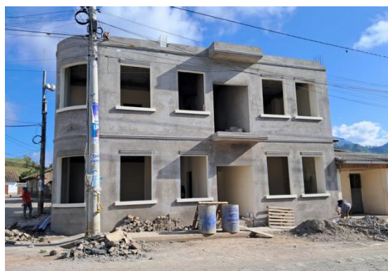
Constatación de trabajos de construcción de la obra casa parroquial.