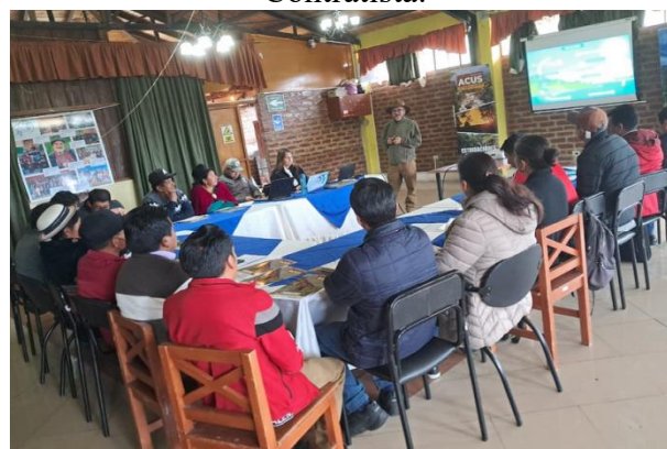
Participación en ACUS provincial realizado en la Parroquia Salinas.