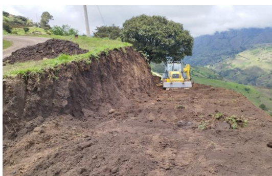
Coordinación de maquinarias en aperturas de entradas en la comunidad de Shulala.