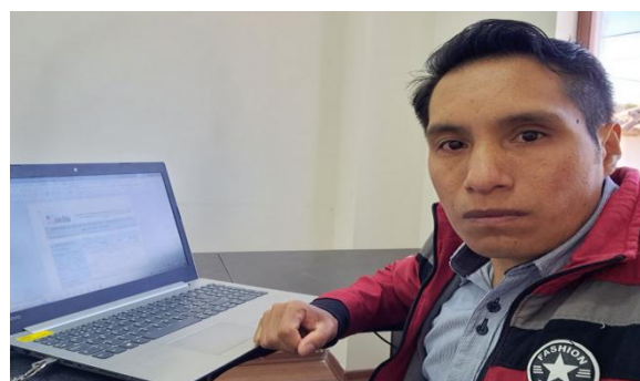
Elaboración de Informe de necesidad y Especificaciones Técnicas para la adquisición de repuestos y accesorios para la retroexcavadora y volqueta del GAD parroquial San Simón.